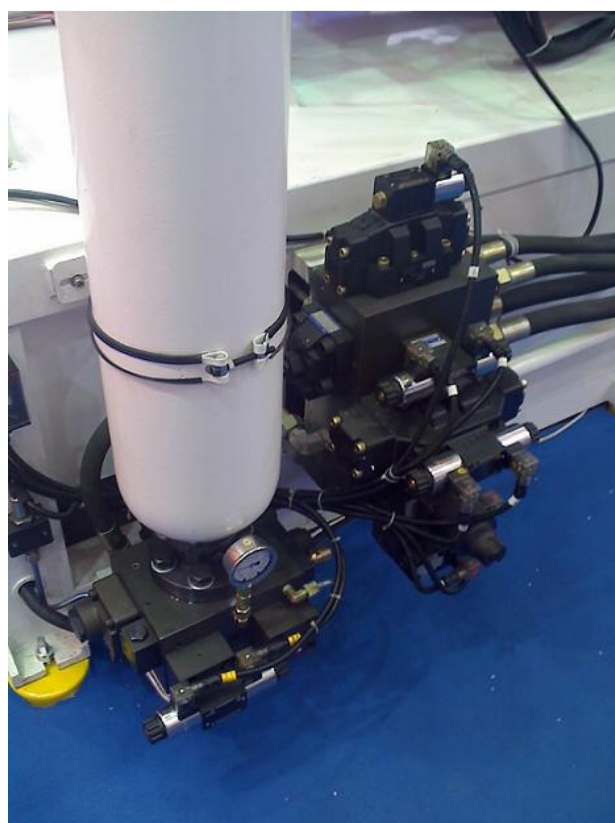
Sistema de Acumulador na injeção