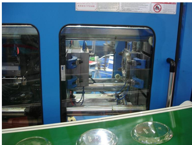
Injetora veloz foi atração na feira: 4,5 segundos

Estande da SanShun foi muito visitado na feira chinesa, dez dias após a exibição da marca na Plastshow pela Plastbase - representante exclusiva no Brasil.