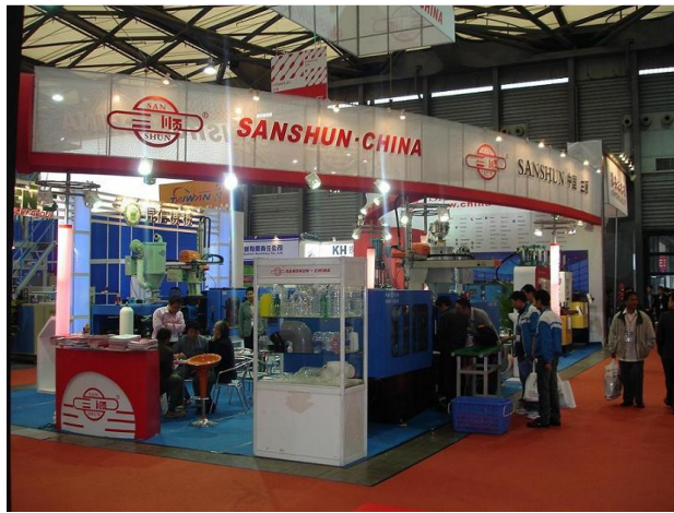
Mais visitantes brasileiros, apesar do caos aéreo